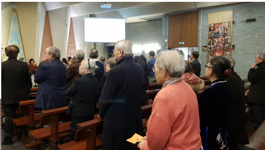
Phong trào mừng Tết Canh Tý tại Giáo xứ Việt Nam Paris