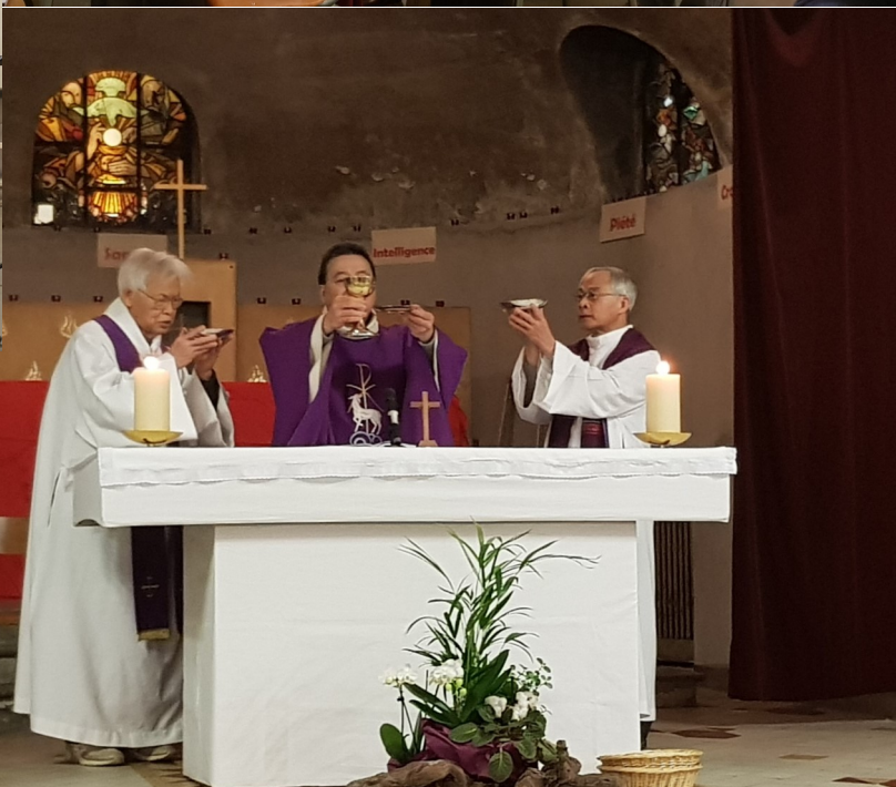
... với cha Ziên giảng phòng và Thánh lễ đồng tế của các cha linh hướng hiện diện.