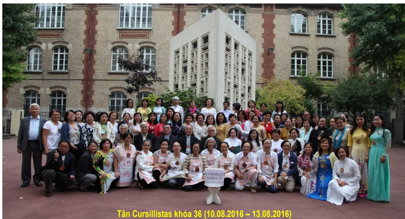
Tân Cursillistas khóa 36 (10.08.2016 – 13.08.2016)