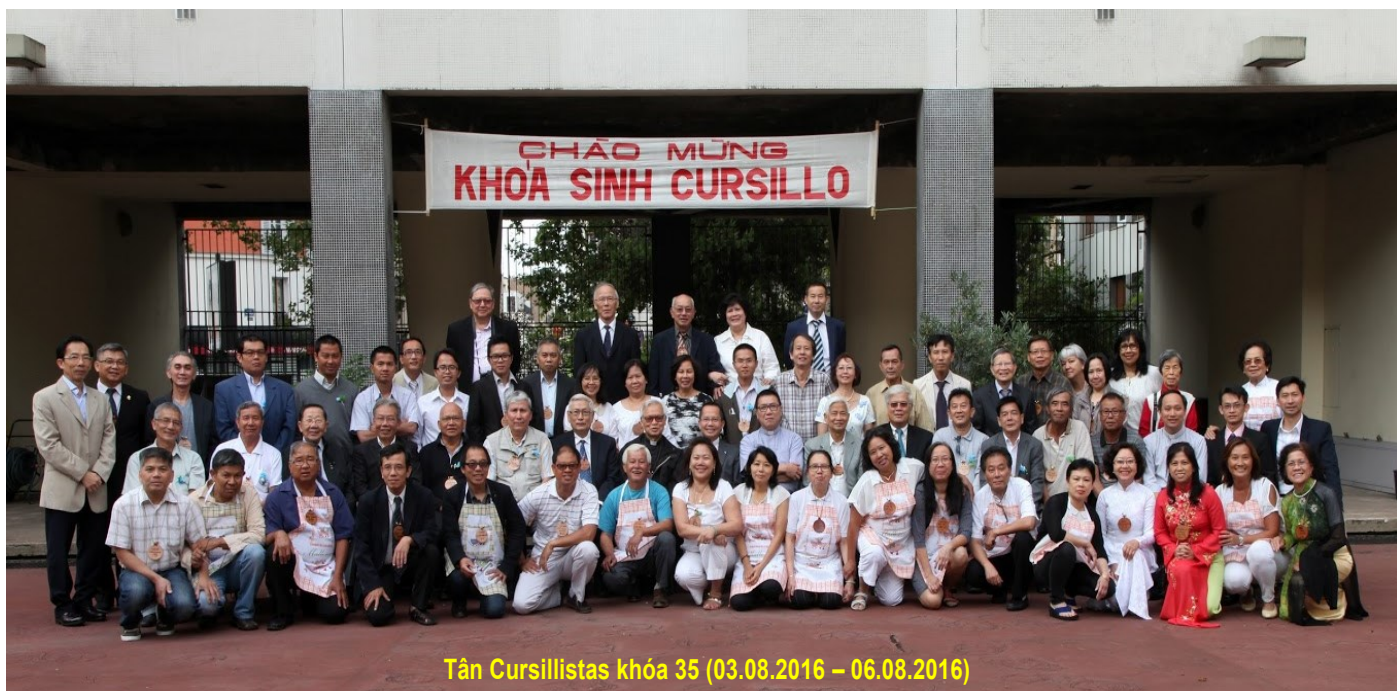
Tân Cursillistas khóa 35 (03.08.2016 – 06.08.2016)